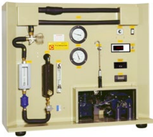
R715** Dispositif de réfrigération de laboratoire