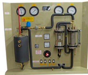
R853 Réfrigérateur/pompe à chaleur à éjection de vapeur