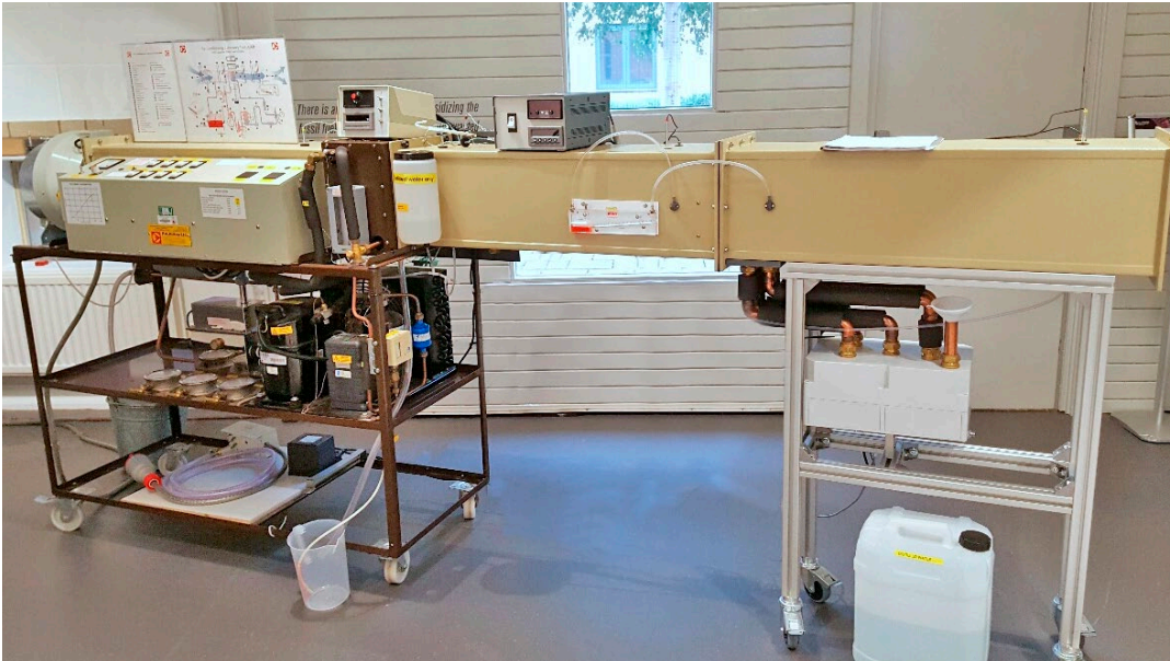
De Montfort – Unité de refroidissement par évaporation sur mesure supplémentaire