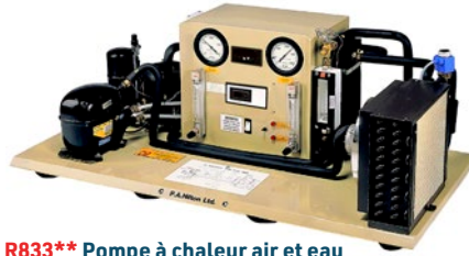
R833** Pompe à chaleur air et eau

**Disponible avec acquisition de données en option et logiciel R100 Enthalpie-Pression en supplément