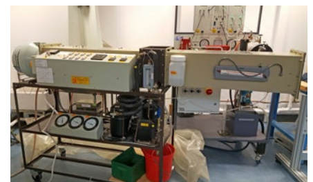
Limerick Institute of Technology – dispositif standard