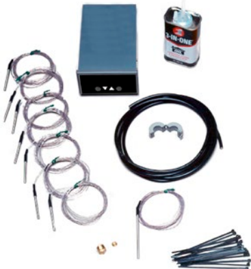
R634A Indicateur de température numérique en option