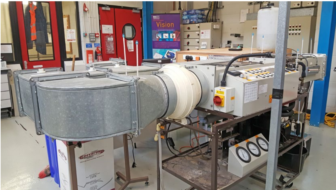
Institute of Technology Tallaght – Conduit de recirculation sur mesure