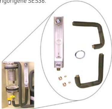
R634R Extension Débitmètre du fluide frigorigène